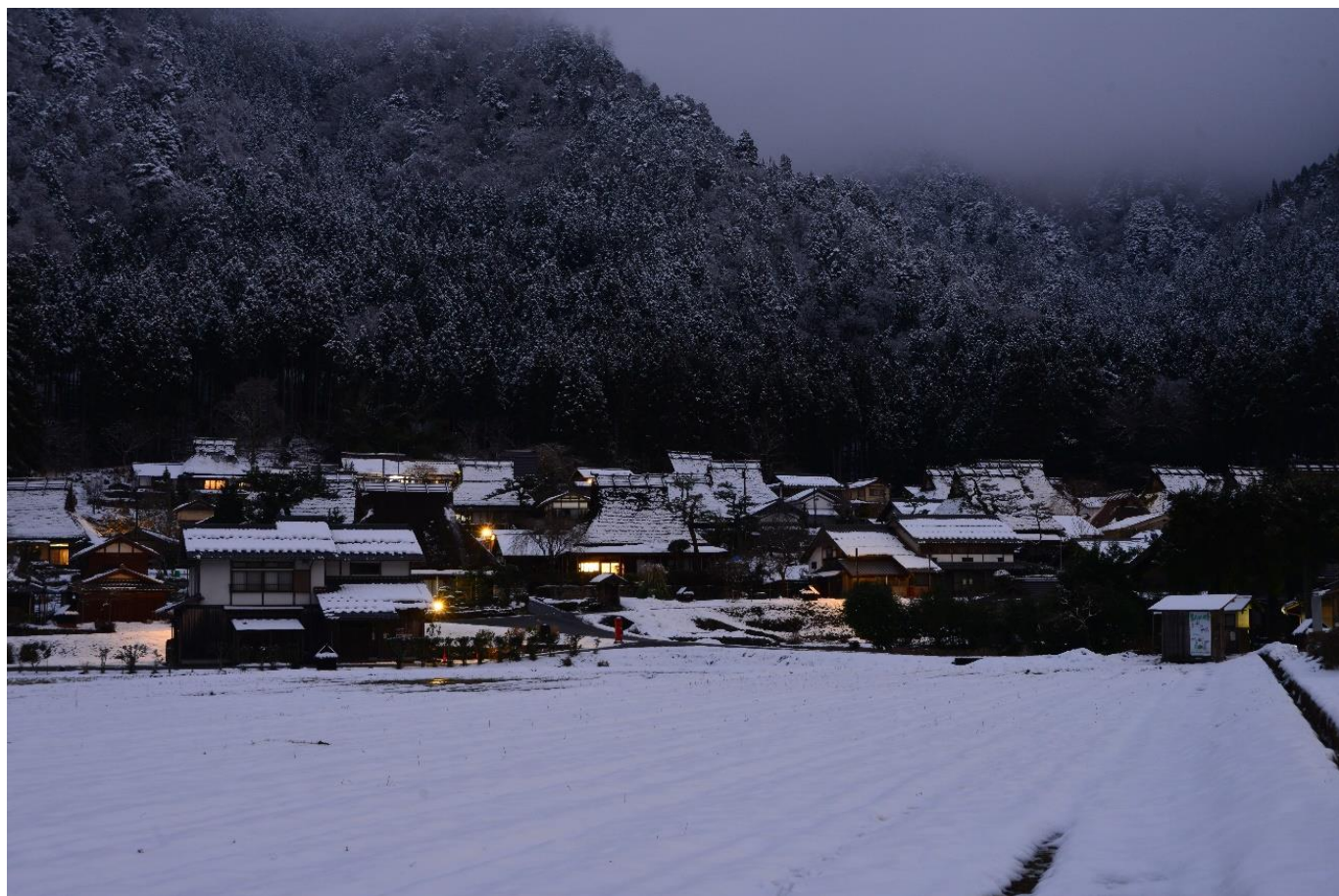
京都府美山 早朝の「美山かやぶきの里」