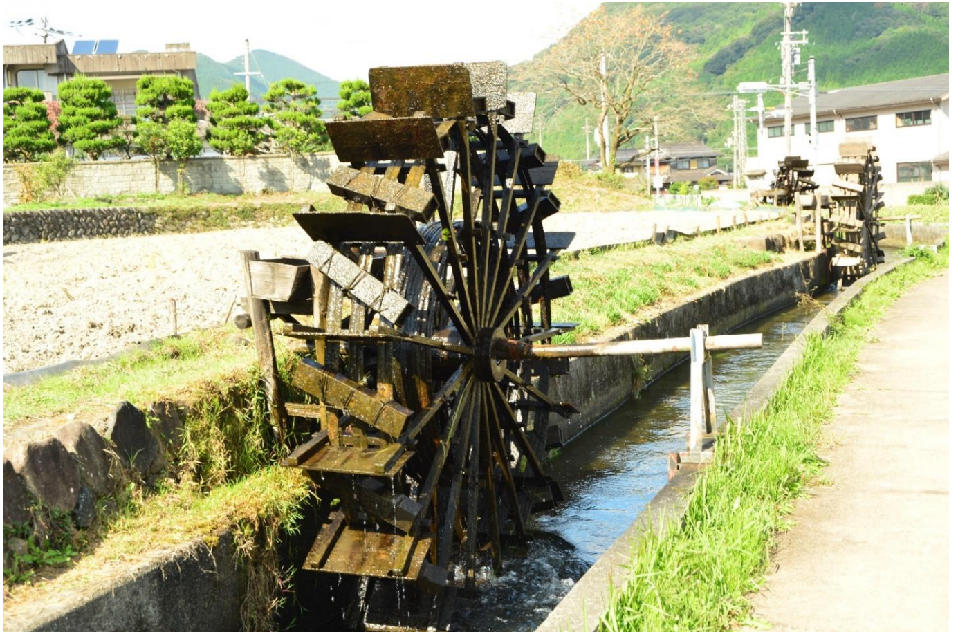
兵庫県神河町新野