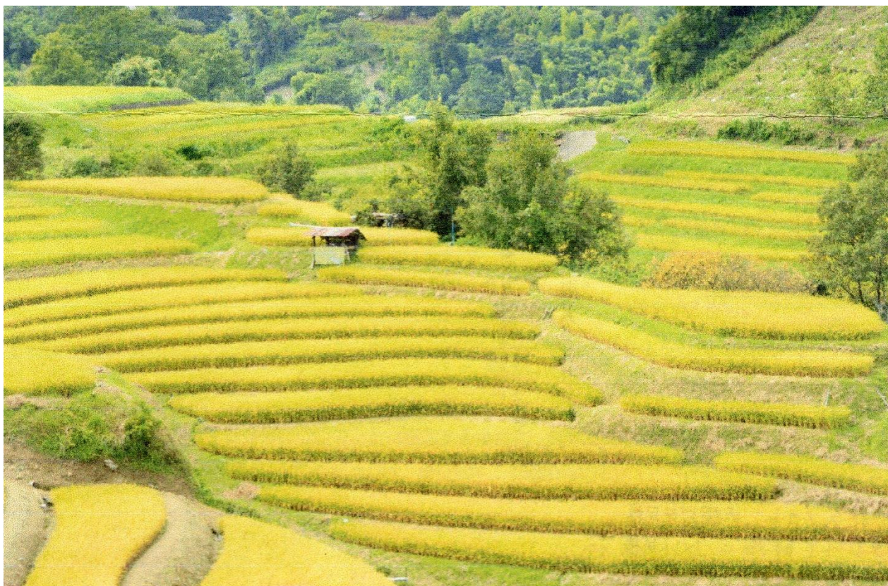
大阪府 千早赤坂村 9月中旬