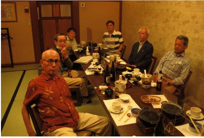
がんこ寿司梅田本店での総会