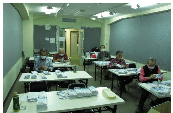
応募要項 発送作業

令和4年6月18日(土)に大阪写真会館にて、「日本大判写真展」2023 応募要項発送作業が行われました。関西在住の会員にイメージサークル6月号で協力お願いしましたが、作業に参加してくれたのはしたのは6名でした。あれほどお願いしたのにこのありさまで。