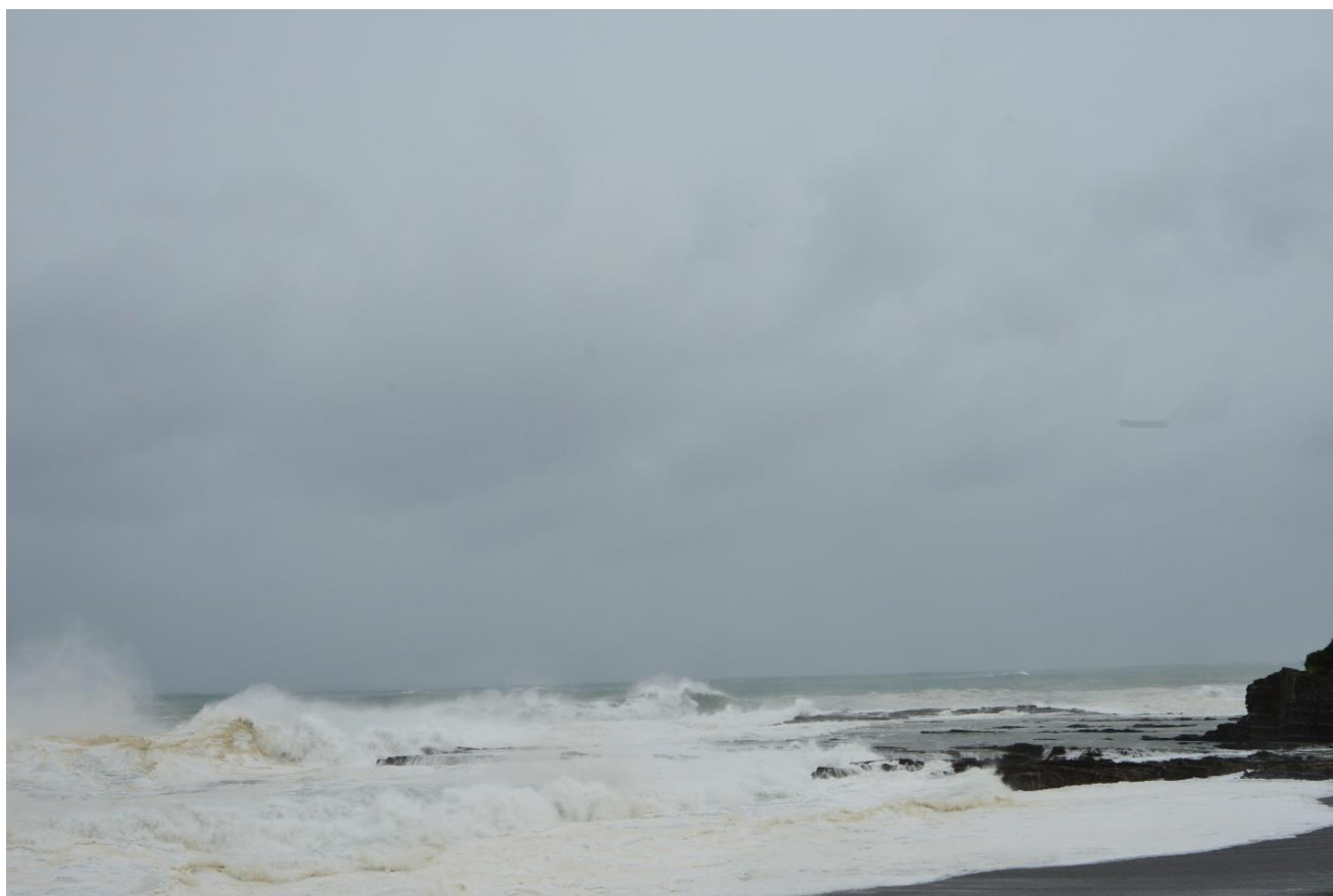
「台風接近」 和歌山県志原海岸 2015年7月16日