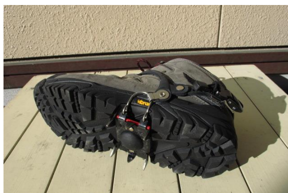
四つ爪アイゼンを装着した写真

「御船の滝」は奈良県川上村にある落差約50mの綺麗な滝。春から初夏の新緑、秋の紅葉が美しい。さらに冬には氷瀑が見られます。大阪方面からだとも吉野川沿いの国道 169 号線を南下し、道の駅「杉の湯」を超え、井戸の武光橋を渡るとすぐに右折して井光川沿いに林道を上っていく。井氷鹿の里のあたりで車は通行止めとなるので駐車し徒歩で行く。約1時間で「御船の滝」につきます。