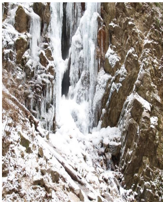
氷瀑の「七曲がりの滝」

「七曲がりの滝」は六甲山の北側に位置します。神戸電鉄有馬温泉駅より徒歩1時間30分で行けます。車では六甲有馬ロープウェイの有馬温泉駅の駐車場から徒歩1時間で行けます。「七曲がりの滝」までの道はここ数年に台風の影響で登山道が崩れ、まわり道となっています。行かれる場合はインターネットで最新の情報を得て実行してください。