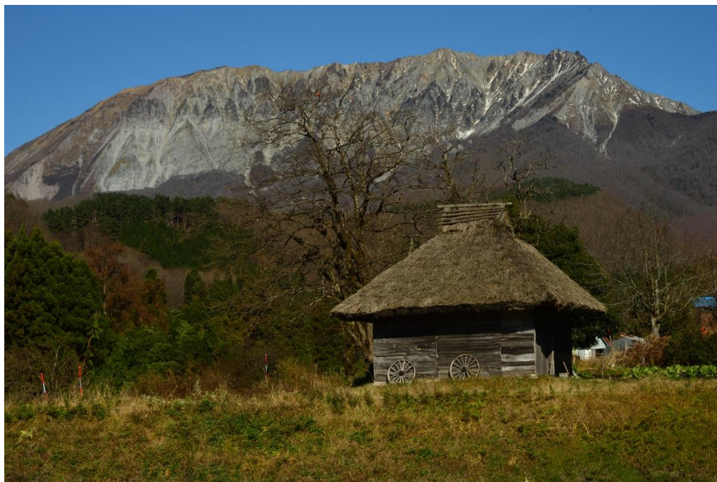
大山付近 2016年12月02日 撮影