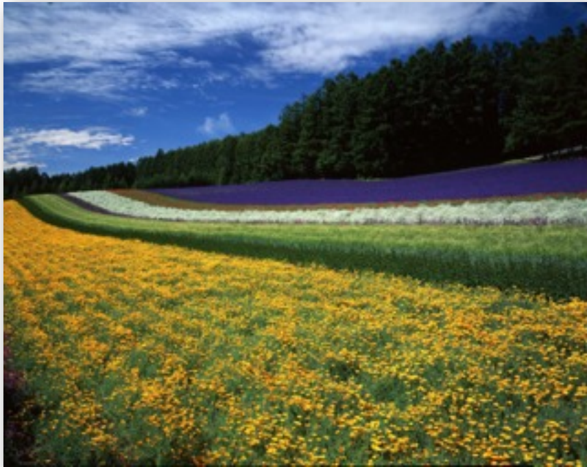
「富田ファーム」 鶴見成雄 北海道中富良野町 7月下旬 8x10 RVP50